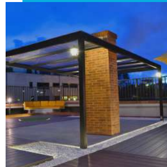
Deck en WPC. Cubierta Piso 8 Edificio Golf Palace, Bogotá