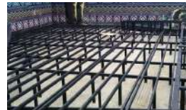
Estructura en acero estructural para piso Deck