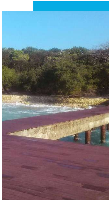
Piso en WPC, Muelle, Baru - Cartagena