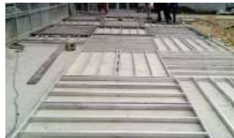
Perfilería en Aluminio para Piso Deck

Ensayos realizados en el laboratorio de materiales, Departamento de Ingeniería Mecánica, Universidad de los Andes - 2011, sobre tablón de piso color amarillo Guajira.